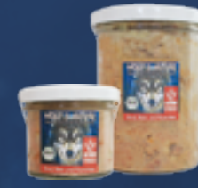
Rind, Reis und Karotten

Rohprotein.....6,0 % Rohöle und -fette.....4,0 % Rohfaser.....0,5 % Rohasche.....2,5 % Feuchtigkeit.....74,0 %