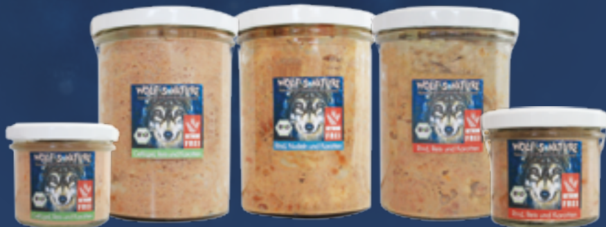
Alleinfuttermittel für Hunde