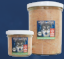
Geflügel, Reis und Karotten

Rohprotein.....8,0 % Rohöle und -fette.....5,0 % Rohfaser.....2,0 % Rohasche.....3,0 % Feuchtigkeit.....71,0 %