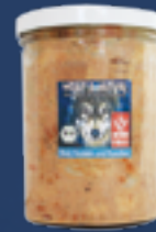
Rind, Nudeln und Karotten

Ein saftiges Bio-Menü für alle Liebhaber des guten Geschmacks! Inhalt: 400 g